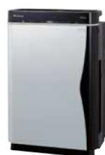
PURIFICADOR + HUMIDIFICADOR (MCK75J)